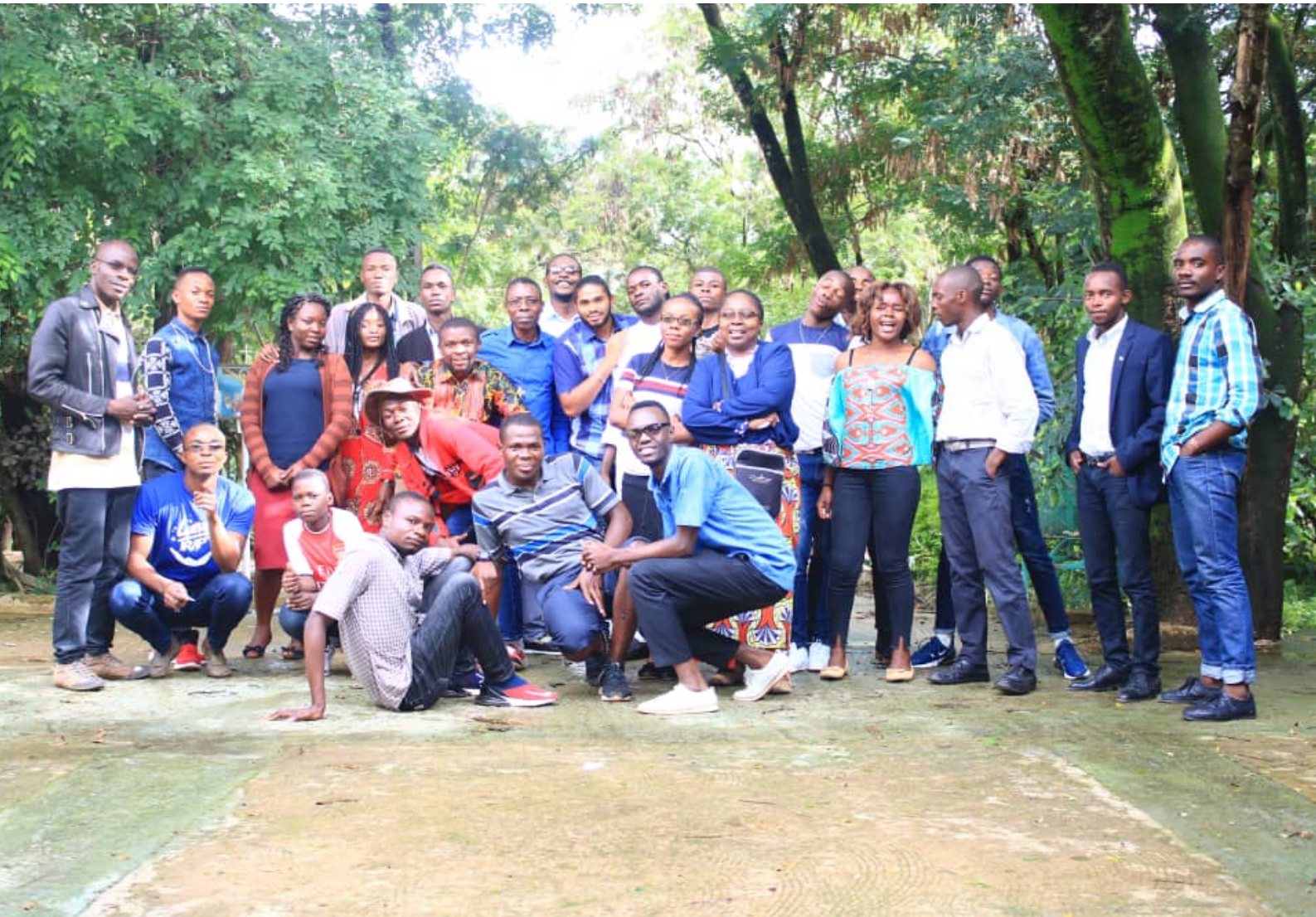
Photo de Famille lors de la réunion Fin Mandat 2019

Maison de Formation Culturelle et chrétienne 122, AV LIKASI COIN KAMANYOLA - LUBUMBASHI - HAUT-KATANGA - RD CONGO +243 (0) 974 830 161 - www.maisonsafina.org